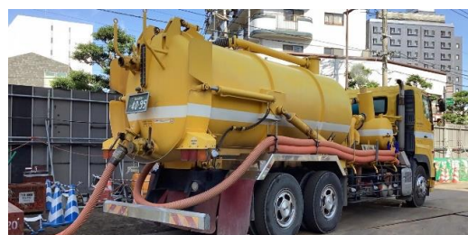
ポンプ車作業状況